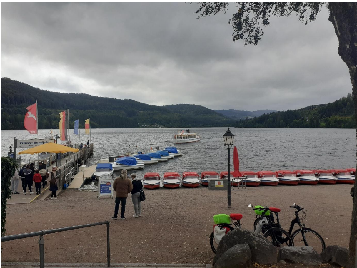
Ausblick auf den Titisee

Gleich kommt die Gruppe zurück, dann ist dieser Moment vorbei, und alles geht weiter, so wie die Welt, die sich währenddessen weitergedreht hat in ihrer ewigen Bewegung, unbeeindruckt von diesen Betrachtungen.