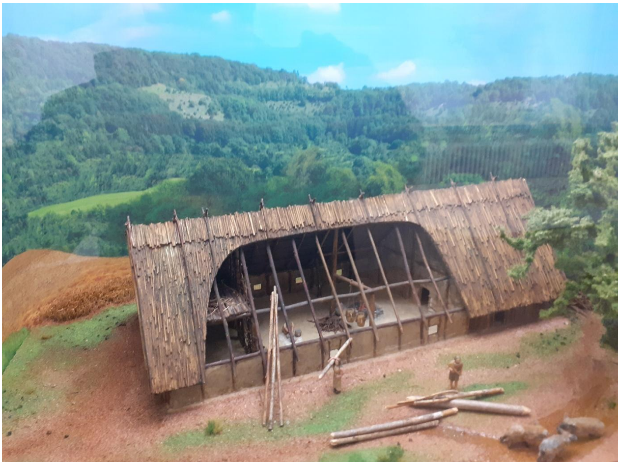
Ausstellungsstück im Museum

Besonderheiten: Sehr sehenswerter, prächtiger Treppenaufgang zentral im Innern des Colombi-Schlösschens.