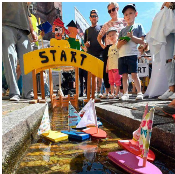
11. Freiburger-Bächleboot-Rennen

Im Anschluss ging es mit dem Menü dann richtig los. Das Hauptmenü wurde angeboten und wartete darauf, erobert zu werden. Ein nicht enden wollendes Nachspeisen-Bufferet war der krönende Abschluss.