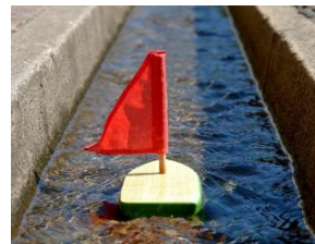
Bild: Ein Freiburger Bächleboot der 1. Generation

Die R'elan-Schreinerei (damals in Endingen) erhielt im Jahr 2001 eine Anfrage von der Firma Winterhalter in unmittelbarer Nachbarschaft, ...