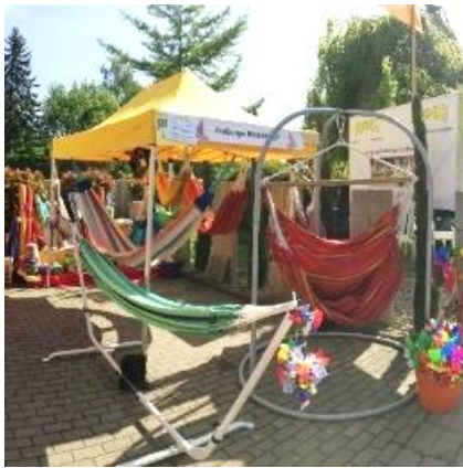
REHA, aha... Juni 2018, Nr. 48

Der Sonntag am 22.04.2018: Umstrittener Ordnungsamtschef ... hört früher auf ! Mehr Infos hier !