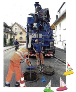
Schweres Reinigungsgerät REHA-Verein: Sich anlegen mit den Großen