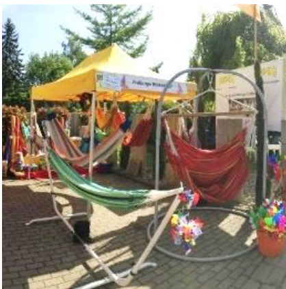
REHA, aha... Juni 2018, Nr. 48

Der Sonntag am 22.04.2018: Umstrittener Ordnungsamtschef ... hört früher auf ! Mehr Infos hier!