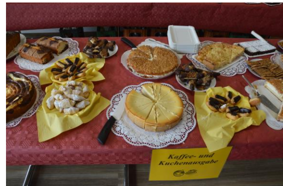
Ausgabe der selbstgebackenen Kuchen

Gut gestärkt brachen dann die ersten Grüppchen auf, um sich zu Kaffee und Kuchen in Freiburg in der Attika der Berliner Allee wieder zu treffen. Die Kuchen wurden von den Besuchern und Mitarbeitern der verschiedenen Projekte, des REHA-Vereins gebacken.