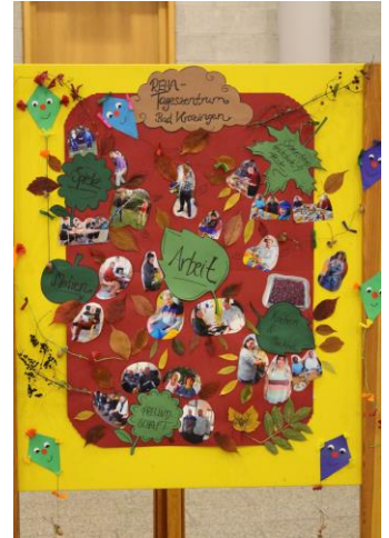
Stellwand des Tageszentrum Bad Krozingen