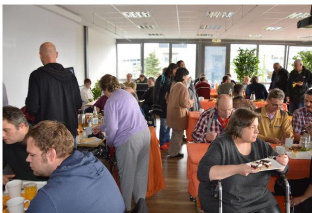
Kaffee und Kuchen in der Attika