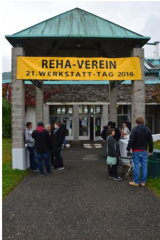
Bürgerhaus am Seepark

Am 21. Oktober 2016 fand im Bürgerhaus am Seepark erneut der Werkstatt-Tag statt, an welchem die gesamte Projekte des REHA-Vereins zusammen kamen.