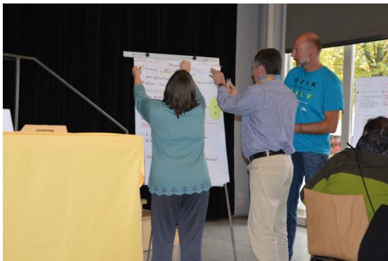
Vorstellung der Kleingruppenarbeit

Anschließend wurden Kleingruppen gebildet, in welchen die Teilnehmer dann ihre Arbeit in den Werkstätten bzw. ihr Zusammensein in den Tageszentren besprechen konnten. Jeder konnte äußern was ihm gefällt und was ihm nicht gefällt oder stört. Die Punkte wurden gesammelt und auf einem Plakat zusammengetragen, welches jede Kleingruppe durch einen Redner schließlich wieder in der großen Runde vorstellte.