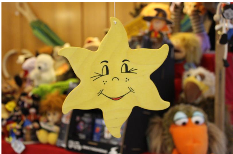
Stand des REHA-Ladens