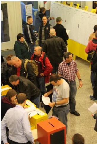
Anmeldung der Besucher