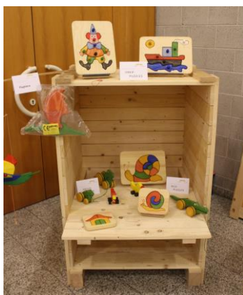
Holzspielzeug gefertigt in der REHA- Werkstatt