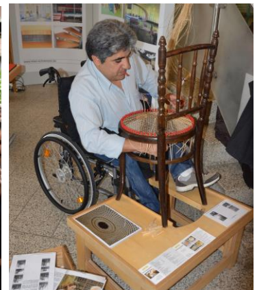
Stuhlflechter Herr T.