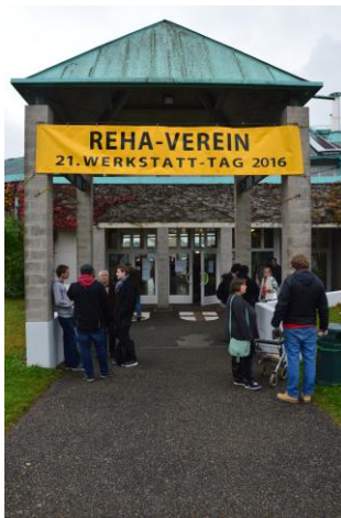
Bürgerhaus am Seepark

Am 21. Oktober 2016 fand im Bürgerhaus am Seepark erneut der Werkstatt-Tag statt, an welchem die gesamte Projekte des REHA-Vereins zusammen kamen.