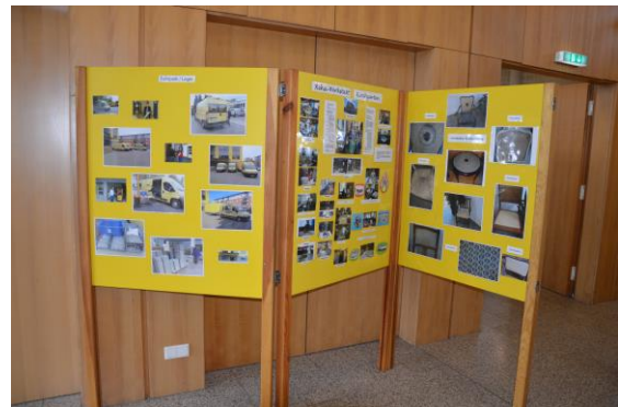
Stellwände der REHA-Werkstatt

Bevor der offizielle Teil richtig losging, stärkten sich die Besucher erstmals noch mit Kaffee, Tee und Laugenknoten. Danach wurden die Anwesenden begrüßt und es folgte der Bericht des Werkstattrates sowie der Geschäfts- und Werkstattleitung.