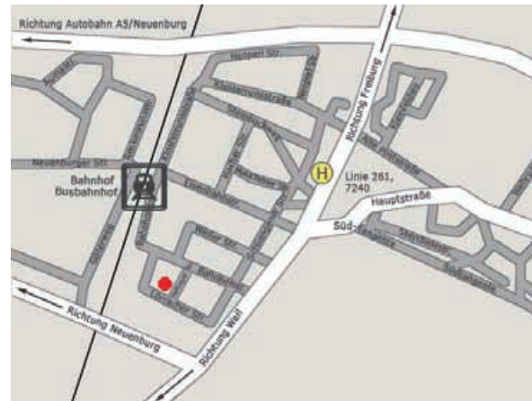
Wegskizze • Haltinger Str. 6 in Müllheim