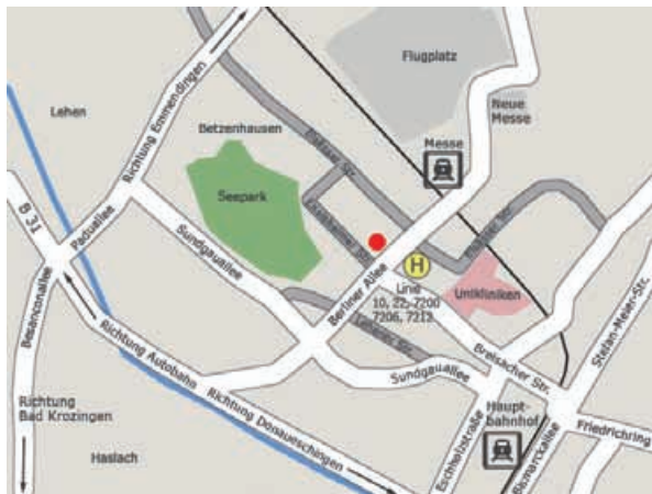
Wegskizze • Berliner Allee 11a in Freiburg